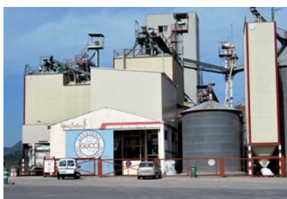
Fábrica GUCO en Matarraña

GUCO (Ganadería Unida Comarcal) es una fábrica de piensos del Grupo Arcoíris fundada 1978. El acta de constitución fue firmada por 52 ganaderos de la Comarca del Matarraña con la finalidad de fabricar piensos conjuntamente. En la actualidad GUCO cuenta con más de 600 socios en Teruel, Zaragoza, Castellón y Tarragona y elabora piensos para todo tipo de ganado, alcanzando una producción de 86.000 toneladas anuales.