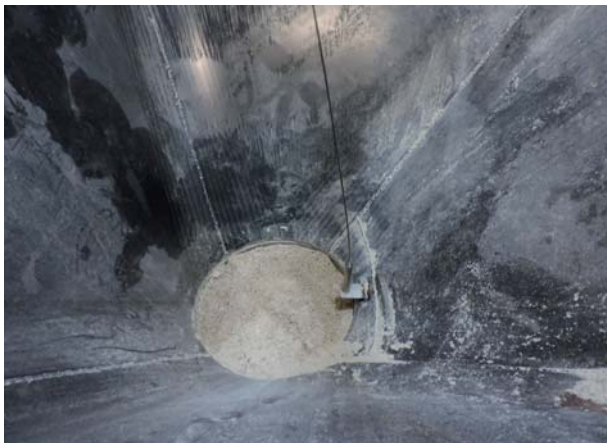
Fijación de la sonda