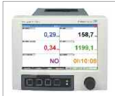
Fig. 4. Resumen de información en la propia unidad.

En la imagen de la figura 4 , a diferencia de la figura 1, se puede apreciar un sistema de monitorización con visualización en continuo de la turbidez instantánea y media, el caudal instantáneo del mosto/vino trasvasado, el volumen movido y el tiempo de trasvase.