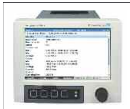
Fig. 3. Resumen de información en la propia unidad.

El sistema, realiza un almacenamiento de los datos mediante un registro por lotes de la producción, lo que facilita la posterior consulta y análisis de información en PC de forma más pormenorizada (ver el apartado de Visualización).