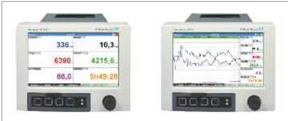
Fig. 1 y 2. Ejemplo de visualización de la monitorización digital y gráfico de prensado de uva.

En la siguiente imagen (figuras 1 y 2), se puede apreciar un sistema de monitorización con visualización en continuo de la turbidez y caudal instantáneo del mosto, la carga de la prensa, el volumen ya extraído, así como el porcentaje extracción realizado para cumplir la D.O. y el tiempo actual de extracción.